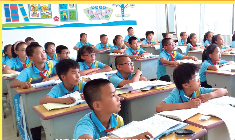
甘肅省張掖市臨澤縣新華鎮明水河小學落成