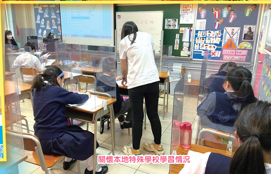
關懷本地特殊學校學習情況