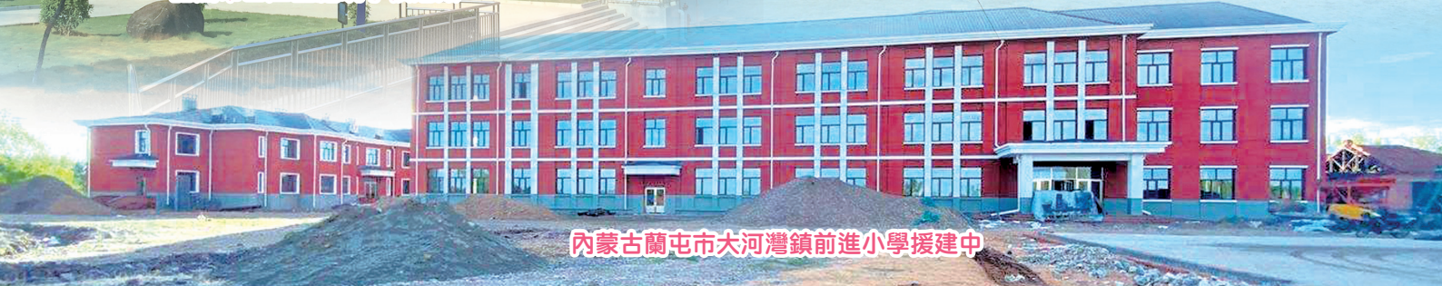
內蒙古蘭屯市大河灣鎮前進小學援建中