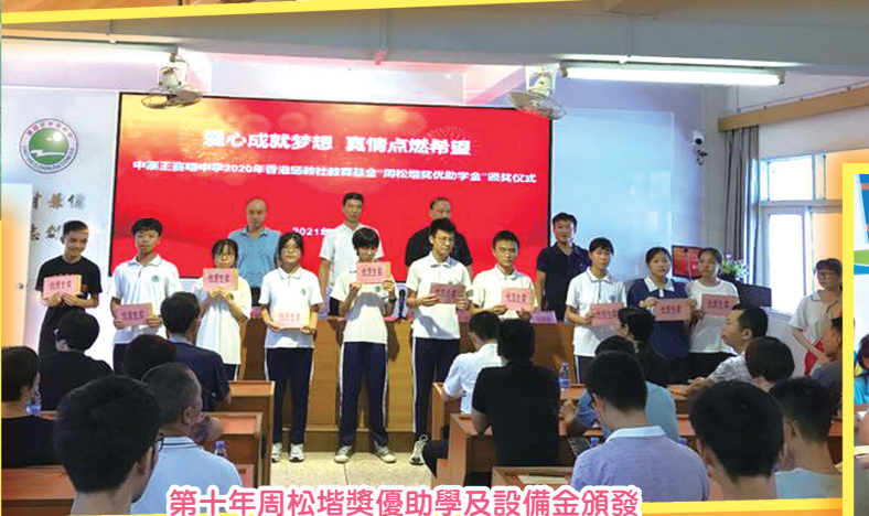
第十年周松塔獎優助學及設備金頒發