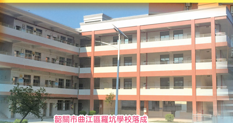
韶關市曲江區羅坑學校落成