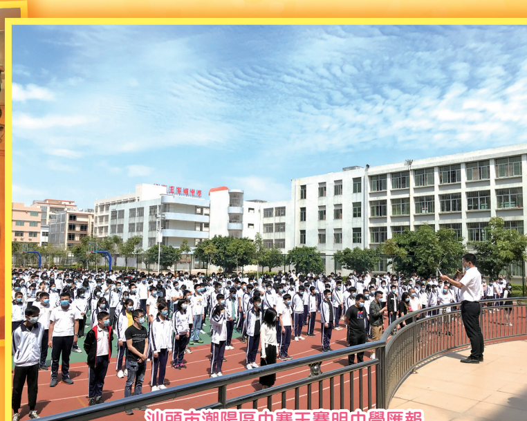
汕頭市潮陽區中寨王賽明中學匯報