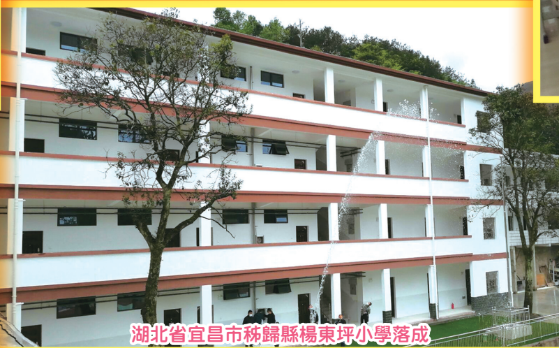
湖北省宜昌市秭歸縣楊東坪小學落成